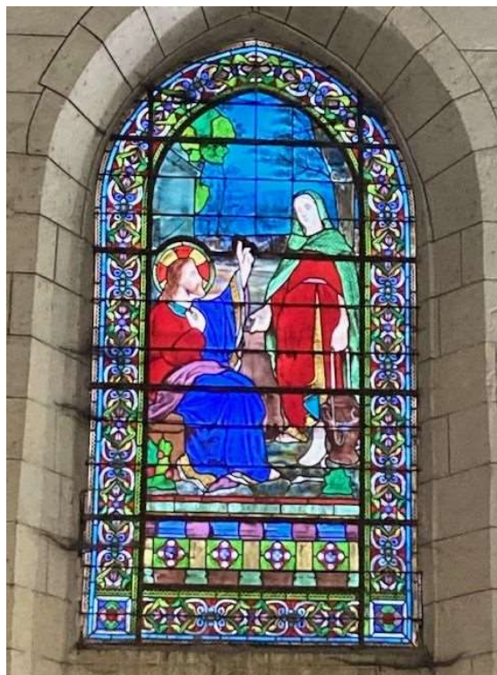
Vitrail église Saint Laurent Mareuil